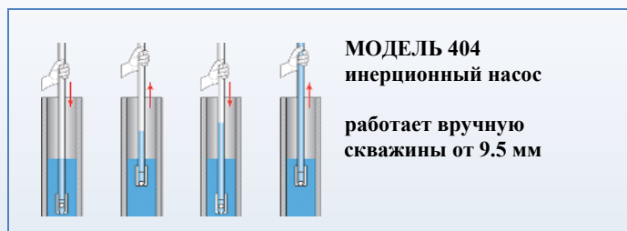
МОДЕЛЬ 404 инерционный насос работает вручную скважины от 9.5 мм