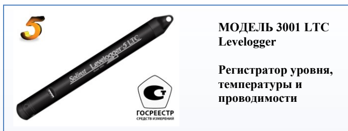
МОДЕЛЬ 3001 LTC Levelogger Регистратор уровня, температуры и проводимости