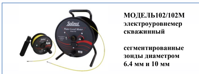
МОДЕЛЬ 102/102M электроуровнемер скважинный сегментированные зонды диаметром 6.4 мм и 10 мм