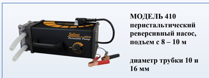
МОДЕЛЬ 410 перистальтический реверсивный насос, подъем с 8 – 10 м диаметр трубки 10 и 16 мм