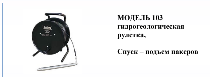
МОДЕЛЬ 103 гидрогеологическая рулетка, Спуск – подъем пакеров